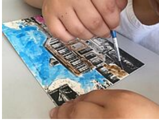
Atelier colorisation de carte postale « Bonjour de Mantes », AM Mantes-la-Jolie)