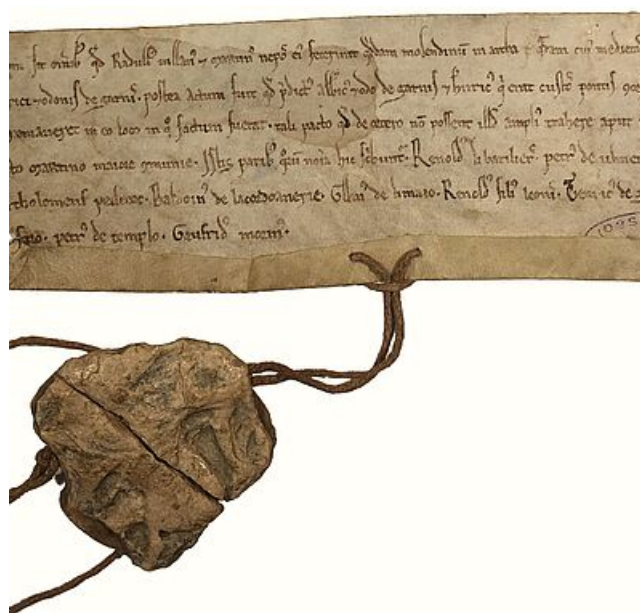
Accord en Raoul Villain, Martin son neveu, Aubri et Eudes de Garnis à propos d'un moulin sis sur le pont de Mantes avec la représentation du 1 er sceau de la ville, XII e siècle, AM Mantes-la-Jolie, II Annexe 10

Les archives de Mantes-la-Jolie remontent au XII e siècle et comptent parmi les plus anciennes du département des Yvelines. Depuis 1110, la Ville de Mantes est libre et s'administre seule. Dès lors, les bourgeois de la ville se réunissent en assemblée et élisent les officiers du corps de ville : les échevins. Cela entraîne une production de nouveaux documents issus du pouvoir communal. Ces archives doivent être conservées et protégées pour justifier des droits de la ville.