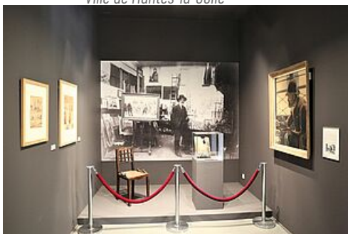
Cabinet des arts graphiques © Mantes-la-Jolie