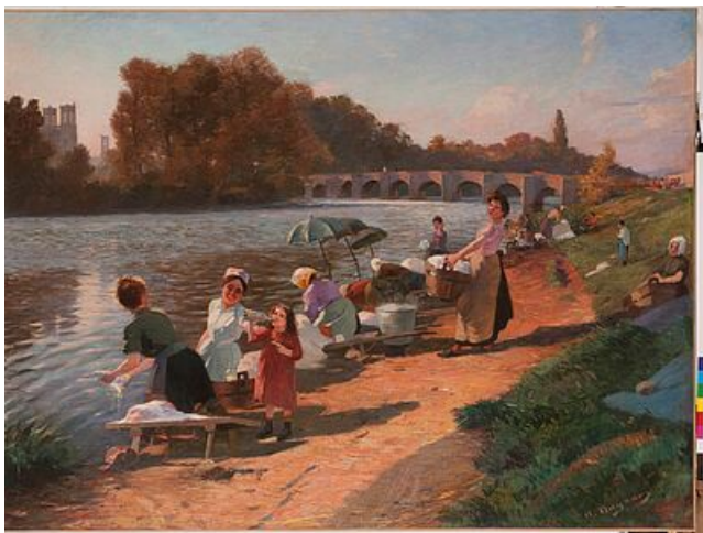
Albert Dagnaux, Les lavandières, 1906