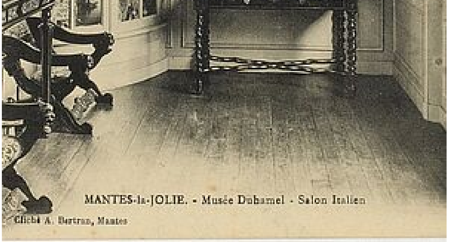
MANTES-la-JOLIE. - Musée Duhamel - Salon Italien