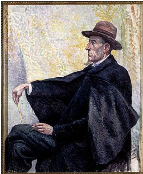
Maximilien Luce, Portrait de Félix Fénéon

En effet, Luce s'installe en 1921 à Rolleboise, à quelques kilomètres de Mantes-la-Jolie. Il y trouve un apaisement et s'intègre dans la lignée des artistes charmés par la Seine et ses motifs. Après tout, nous ne sommes qu'à quelques kilomètres de Giverny et de la demeure de Claude Monet.