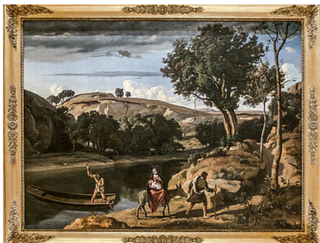
Jean-Baptiste Camille Corot, La Fuite en Egypte

Tout au long de l'année, le musée organise des expositions temporaires. Elles sont l'occasion d'approfondir nos connaissances sur les collections du musée et de faire découvrir au visiteur l'histoire et le contexte mantais d'hier et aujourd'hui.