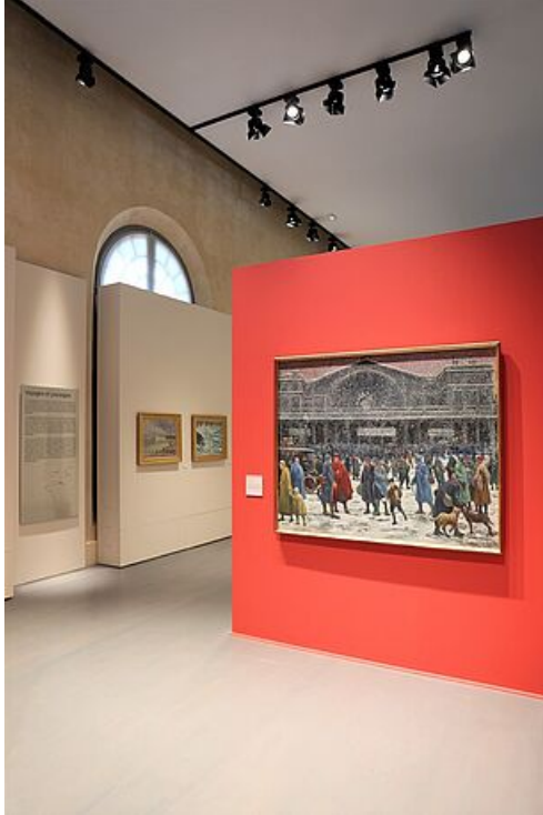
Collection Maximilien Luce © Mantes-la-Jolie