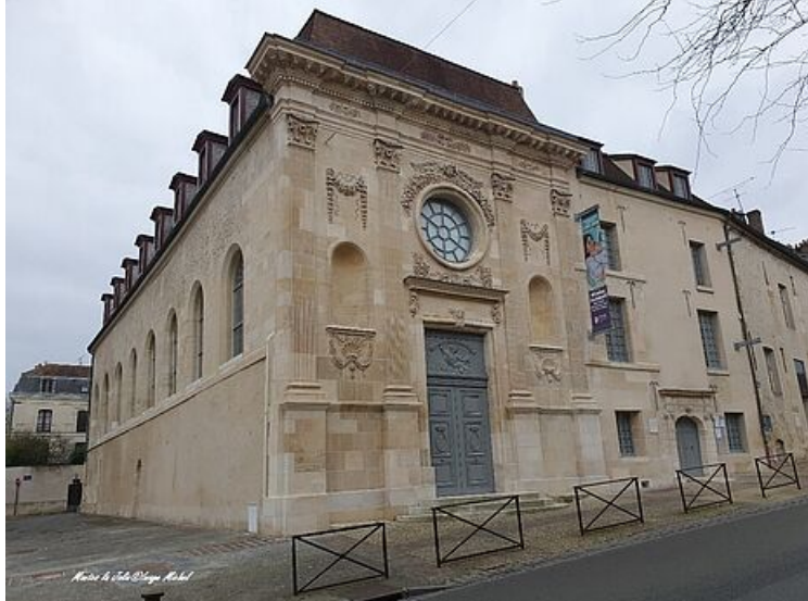
Chapelle après restauration