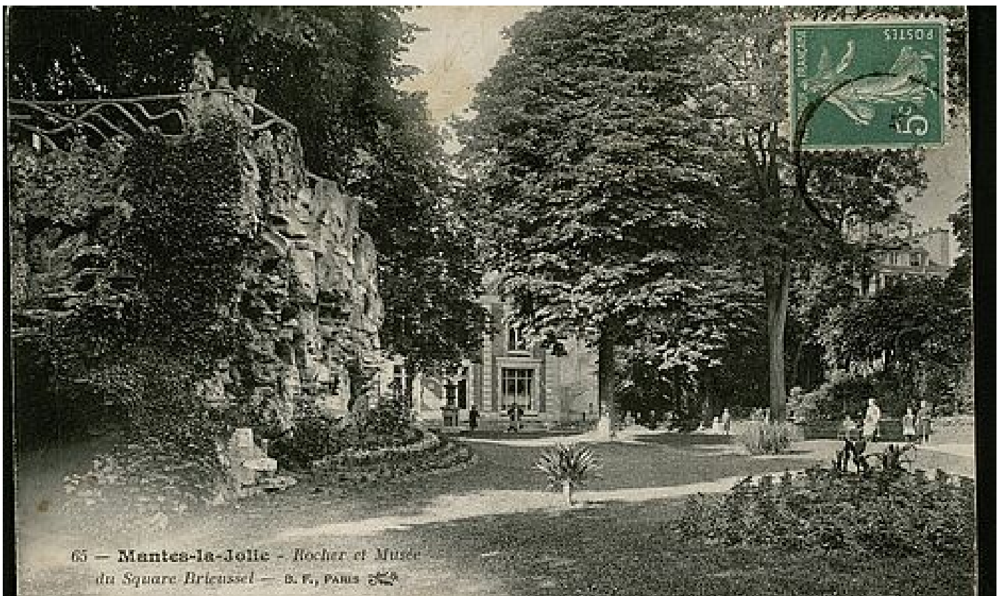
65 — Mantes-la-Jolie - Rocher et Musée du Square Briussel — B. F., PARIS

L'histoire des musées à Mantes-la-Jolie ne démarre pas avec l'Hôtel-Dieu. Trois collectionneurs privés ont offert leurs collections à la ville à partir de la fin du XIX e siècle. Elles sont aujourd'hui conservées dans les réserves municipales, et sont régulièrement valorisées lors d'expositions temporaires au musée.