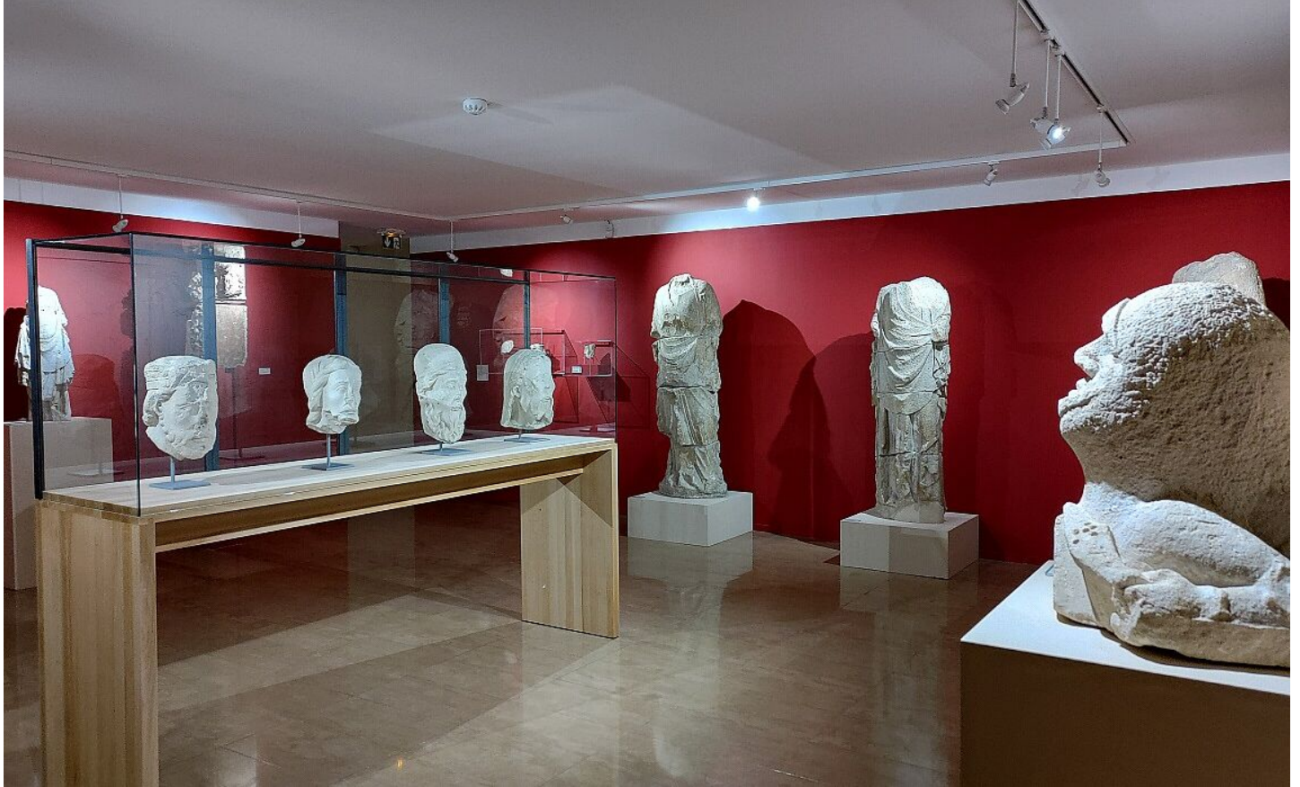
Collection médiévale, Musée de l'Hôtel-Dieu