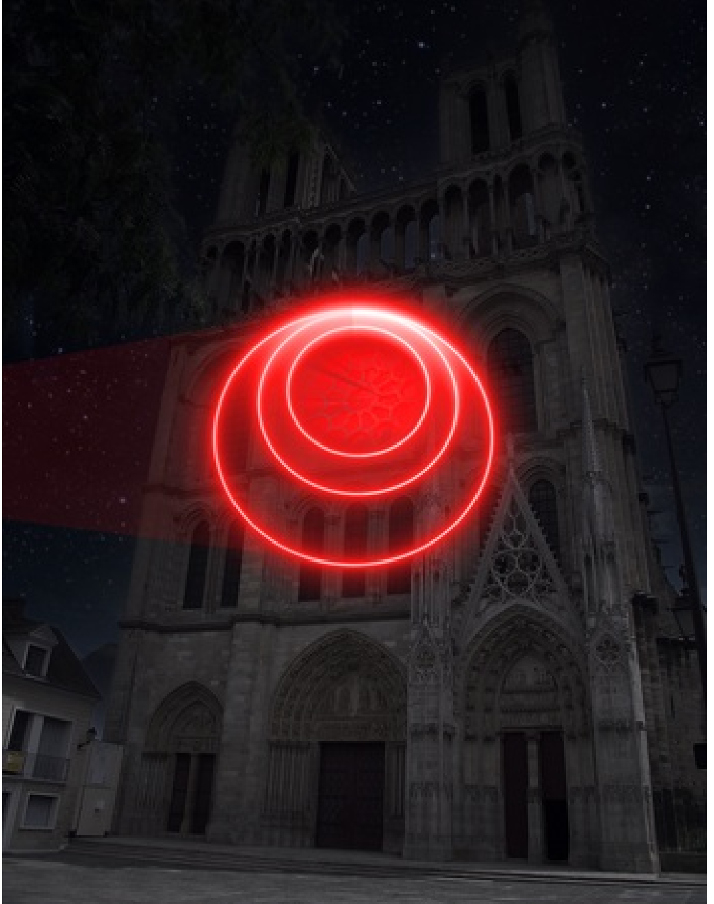
JOSELIN FOUCHÉ Strasbourg, France