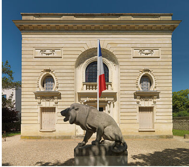
Le pavillon Duhamel côté rue L'Evesque