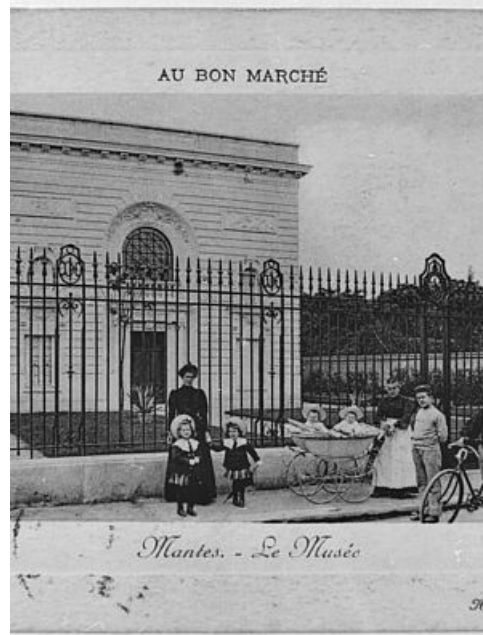
Carte postale du musée Duhamel, XIXe siècle