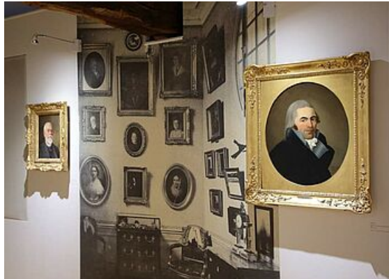
Les collections Duhamel, exposition Mantes et ses musées, musée de l'Hôtel-Dieu 2019