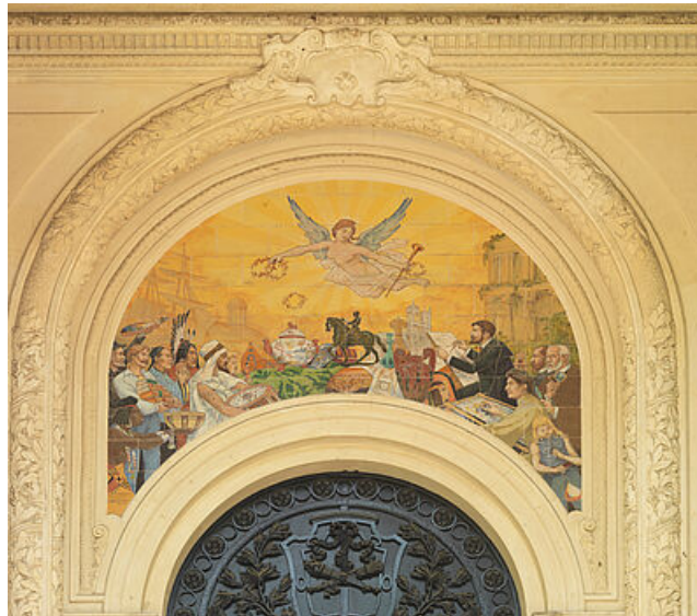
La mosaïque de A. Bonnefoy © Laurent Kruszyk