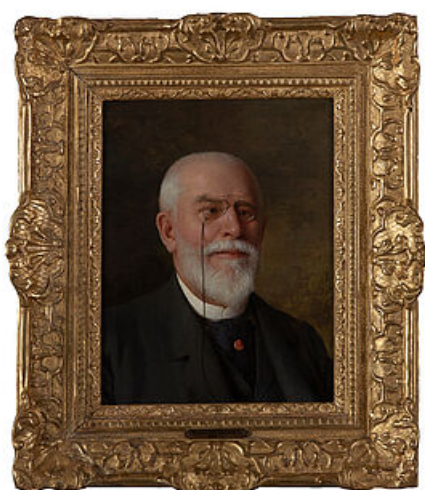
Louise Mercier, portrait de Victor Duhamel, 1904, musée de l'Hôtel-Dieu

Les Duhamel créent un prestigieux écrin pour leurs collections en commandant un édifice à l'architecte parisien Maurice Nalet. Les travaux commencent le 10 mars 1906 et s'achèvent dès 1907. À partir de cette date, les collections sont progressivement installées. C'est le 13 juin 1909 que le musée est inauguré.