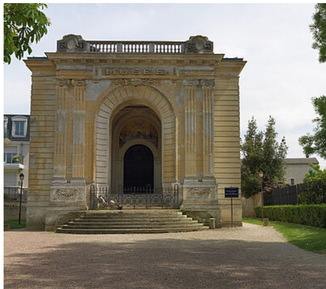
Le pavillon Duhamel côté square Brioussel Bourgeois

Malgré son style architectural encore très inspiré par le néo-classicisme et l'architecture publique monumentale, le Pavillon Duhamel, par sa taille et son volume simple, se présente comme un édifice plutôt intimiste et accueillant. Le pavillon, de plan rectangulaire, est composé d'un volume simple aux proportions harmonieuses. Il se compose de trois étages, tous trois organisés selon la disposition de la pièce à l'italienne entourée d'une galerie. A chaque niveau, de part et d'autre de cette pièce centrale, aux angles, se trouvent quatre pièces symétriques. Le rez-de-chaussée s'organise autour d'un grand hall, autrefois partie principale du musée. L'escalier en est la pièce maîtresse et donne une distribution raffinée des étages. Le grand hall et les galeries du premier étage présentaient des vitrines remplies d'objets. Les pièces d'angle, au rez-de-chaussée et au premier étage, étaient occupées par un salon des fontaines, un salon de famille, salon Empire, un salon Louis XVI, un salon oriental et un salon italien. La décoration de ces salons était conçue pour recréer l'ambiance de ces époques. Ces décors sculptés sont toujours visibles.