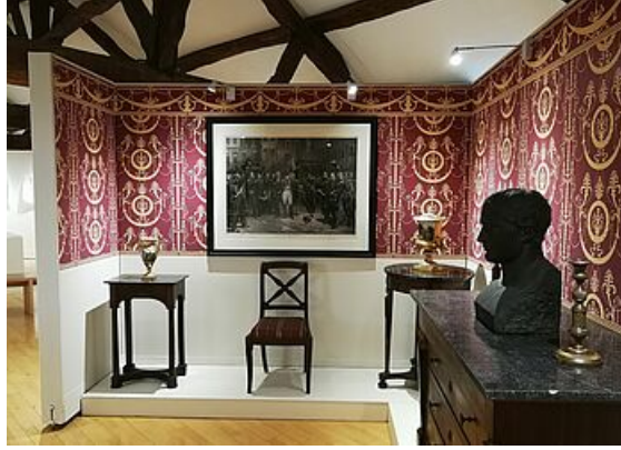
Les collections Duhamel, exposition Mantes et ses musées, musée de l'Hôtel-Dieu 2019