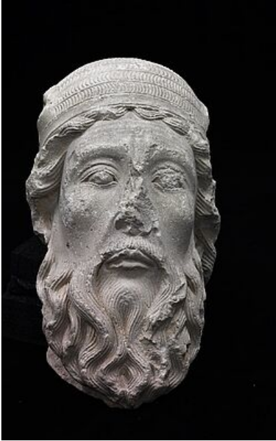
Tête de Prophète, Moïse © Laurent Kruzyck