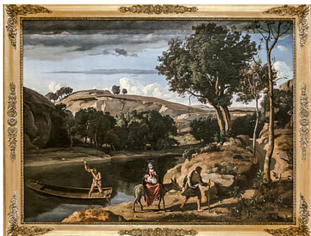
Jean-Baptiste Camille Corot, La Fuite en Egypte

Trouvez ici toutes les informations pour visiter le musée de l'Hôtel-Dieu.