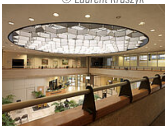
Hall de l'Hôtel de Ville