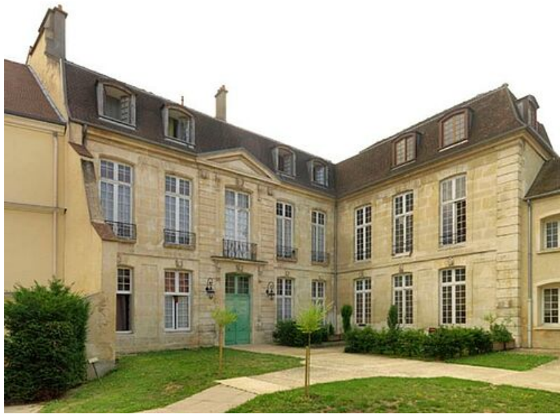
Hôtel Vendôme