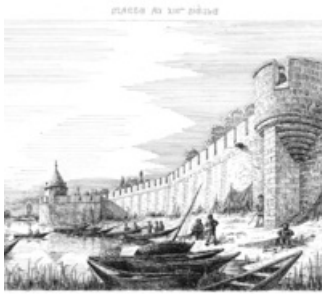
Fortifications de Mantes d'après Eugène Saintier