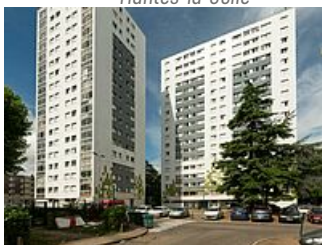
Z.U.P. du Val Fourré - Les deux tours du quartier des aviateurs.