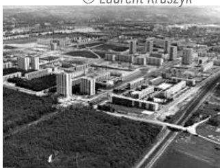
Construction du Val Fourré