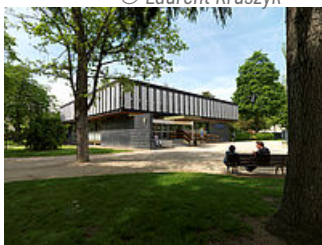
Bibliothèque G. Duhamel