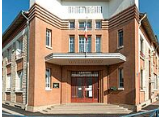
Groupe scolaire F. Buisson par R.Marabout