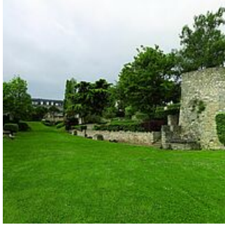
Ravelin Square Gabrielle d'Estrées

Mantes-la-Jolie conserve encore une partie de ses remparts, notamment la porte au Prêtre, et plusieurs monuments remarquables, tels que la Collégiale Notre-Dame, l'Église Sainte-Anne de Gassicourt ou encore le vieux pont de Mantes (XIe siècle), immortalisé par le peintre Jean-Baptiste Camille Corot.