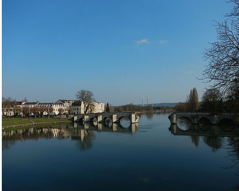
Vieux Pont de Mantes