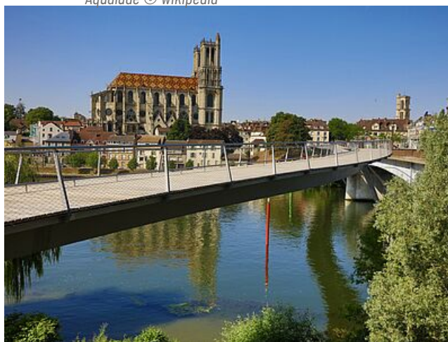
La passerelle

Les bords de Seine offrent aux Mantais un espace de promenade, de pistes cyclables, de plantations et d'aires de jeux long de près de 15 kilomètres. Embellis et protégés, ils offrent une aire de loisir et de détente exceptionnelle.