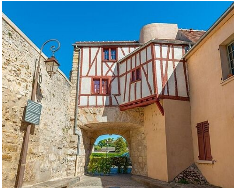
Porte au Prêtres

Mantes-la-Jolie conserve encore une partie de ses remparts, notamment la porte au Prêtre, et plusieurs monuments remarquables, tels que la Collégiale Notre-Dame, l'Église Sainte-Anne de Gassicourt ou encore le vieux pont de Mantes (XIe siècle), immortalisé par le peintre Jean-Baptiste Camille Corot.