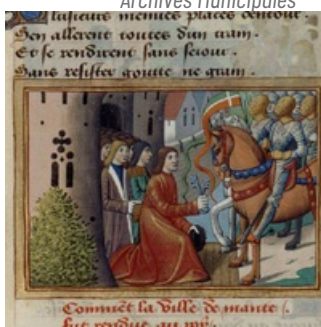
Reddition de Mantes : les Bourgeois remettent les clefs à Dunois, lieutenant général du roi