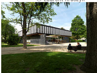
Bibliothèque G. Duhamel