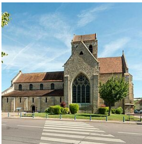
Eglise Sainte-Anne de Gassicourt

, classée monument historique en 1862. La commune de Gassicourt fusionne avec Mantes en 1930 et la nouvelle commune s'appelle Mantes-Gassicourt jusqu'en 1953 où elle devient Mantes-la-Jolie.