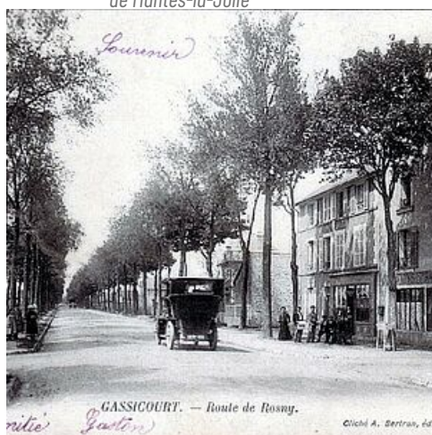
Route de Rosny, Gassicourt © Bertran Editeur