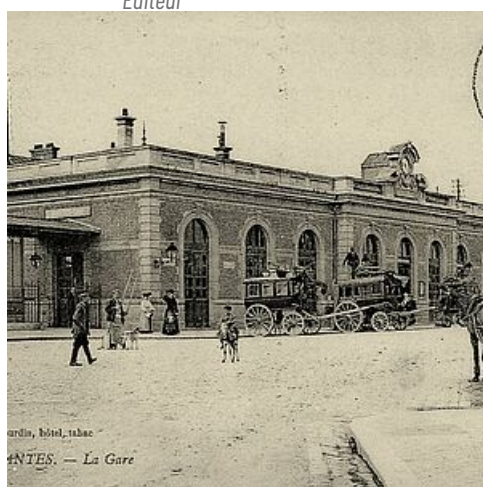
Gare de Mantes-Gassicourt