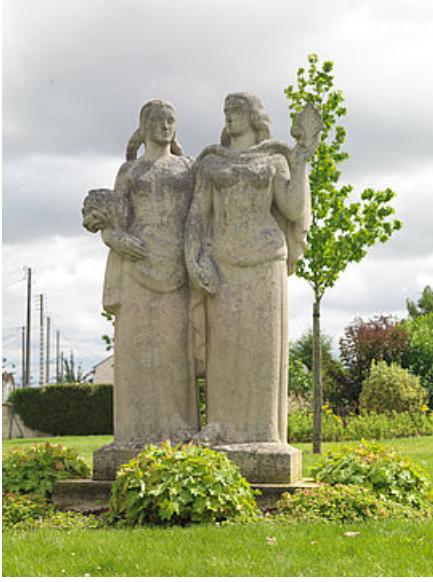
Statues Mantes-Gassicourt © Laurent Kruszyk