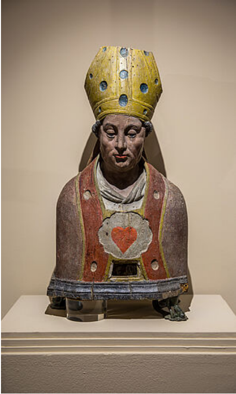
Buste reliquaire de Saint-Eloi, XVIIe siècle, musée de l'Hôtel-Dieu