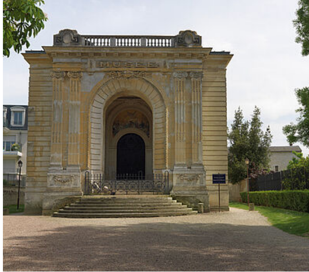
Le pavillon Duhamel côté square Brioussel Bourgeois