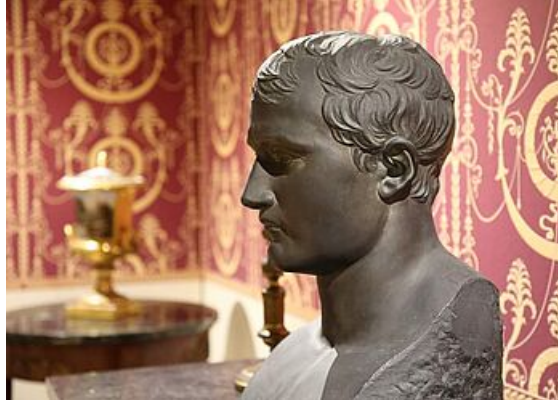
Les collections Duhamel, exposition Mantes et ses musées, musée de l'Hôtel-Dieu 2019