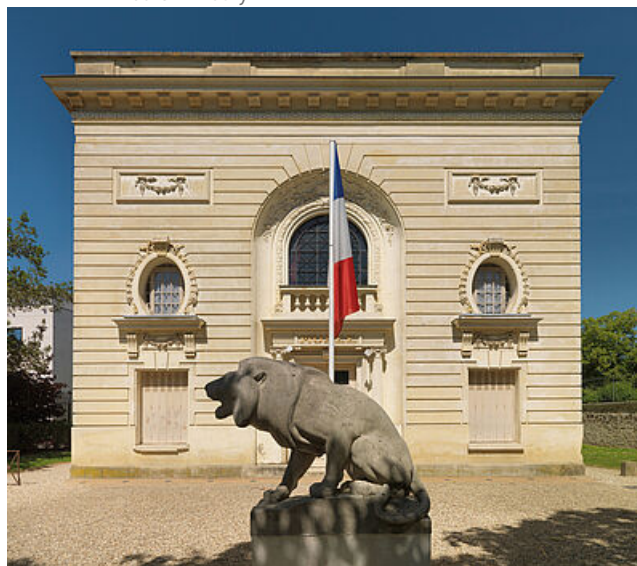
Le pavillon Duhamel côté rue L'Evesque