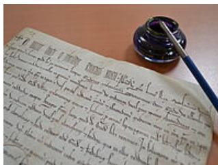
Atelier calligraphie « L'apprenti scribe », AM Mantes-la-Jolie

Vous êtes enseignant ou professionnel de l'éducation et souhaitez sensibiliser des jeunes à un épisode de l'histoire de la ville, à l'évolution de votre quartier, à la transmission des mémoires ? L'équipe de médiation des archives est à votre disposition pour vous proposer des ateliers ou construire avec vous un projet sur mesure. N'hésitez pas à nous contacter.