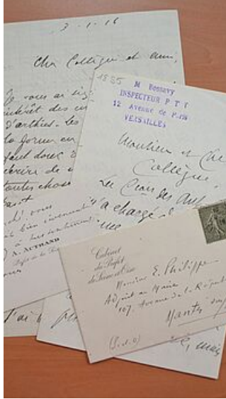
Collection de 4 000 lettres autographes Fonds Clerc de Landresse, s.d., AM Mantes-la-Jolie, 3 S