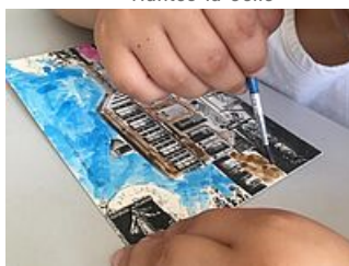
Atelier colorisation de carte postale « Bonjour de Mantès », AM Mantes-la-Jolie)