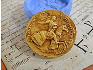
Atelier de sigillographie « Le sceau du roi », AM Mantes-la-Jolie