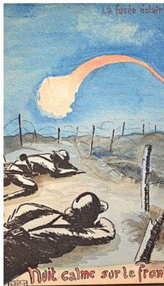
Nuit calme sur le front, 12 novembre 1917, AM Mantes-la-Jolie, 1 DN 85 fonds Louis Got

L'histoire d'une ville et de ses habitants s'écrit aussi grâce aux documents d'origine privée comme les archives des associations ou des familles. Vous êtes propriétaire de documents qui vous semblent utiles pour témoigner de l'histoire mantaise et souhaitez qu'ils soient préservés et qu'ils deviennent accessibles aux chercheurs ? N'hésitez pas à contacter le service.