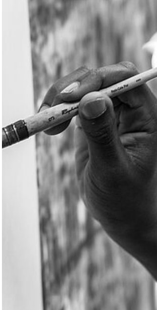
Inspiration, travail photographique de Caroline Boucard dans la salle des matières, 2017