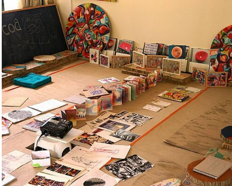
photo de la salle du coô