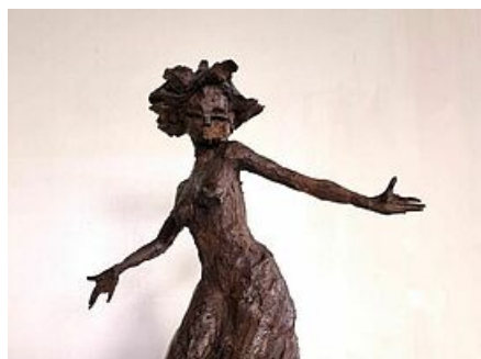
Sculpture de Lydia Konya

Passionnée par l'argile et les techniques du modelage, Lydia vous propose un accompagnement pour la réalisation d'œuvres en terre cuite.