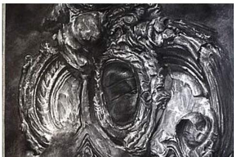
dessin d'Olivier Ponchut