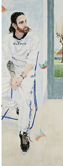
Quelques membres de l'équipe du centre artistique municipal peint par LIN Wenjie, artiste en résidence de 2018 à 2021