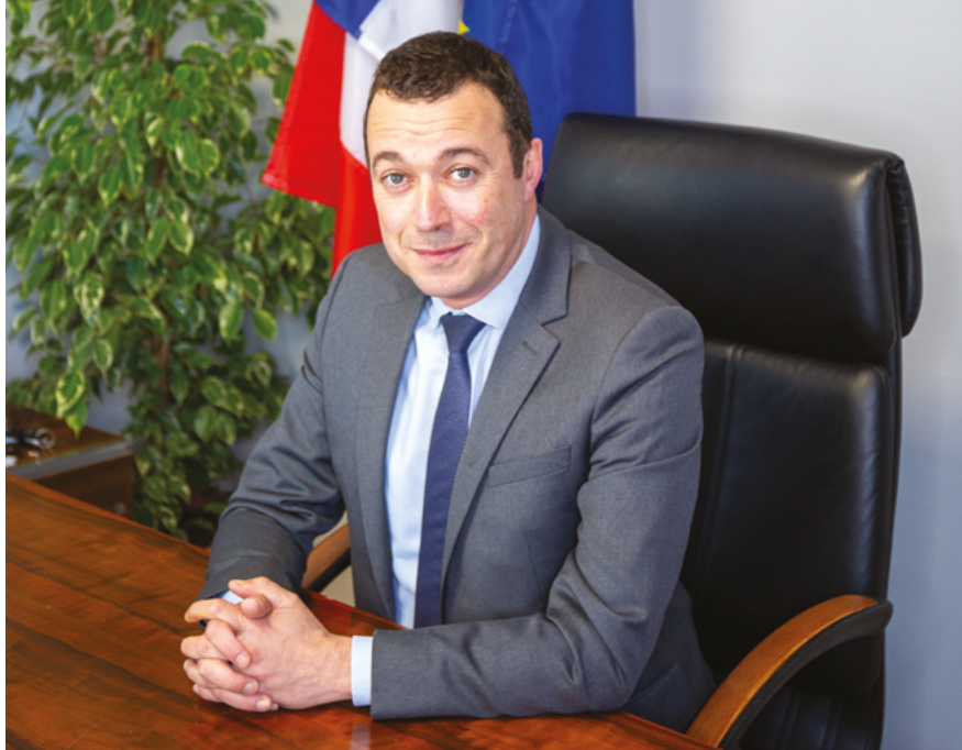
Raphaël Cognet Maire de Mantes-la-Jolie

L'occasion de partager des moments simples, de profiter ensemble de la magie de Noël et de redécouvrir nos quartiers sous une lumière nouvelle.