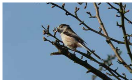
Mésange à longue queue

Vous découvrirez également diverses espèces végétales: trèfles, ray-grass, pâturins, renoncules, plantains, oseille, carottes sauvages, berces et aussi des graminées.