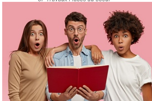
CP Mantes-la-Jolie - Nouvelle politique culturelle, nouvelle programmation