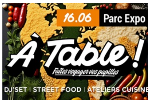
CP - À Table