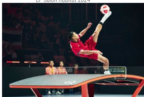
CP Urban Teqball Challenge