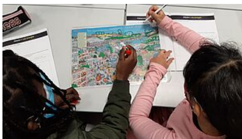
CP défi école