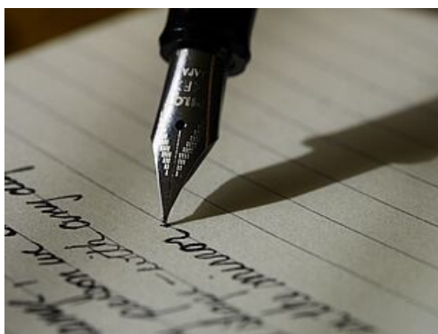
CP réaction du Maire - incidents