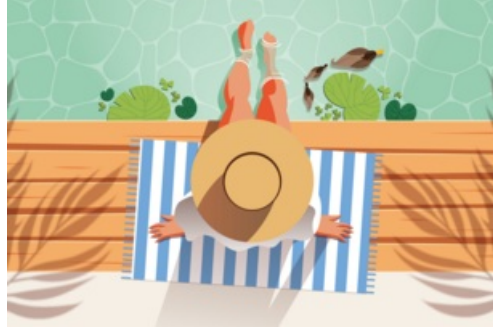
CP Un été à Mantes - 2023