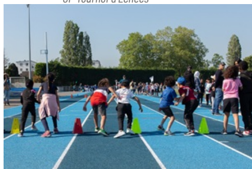
CP - Yvelines Olympiades - juin 2023