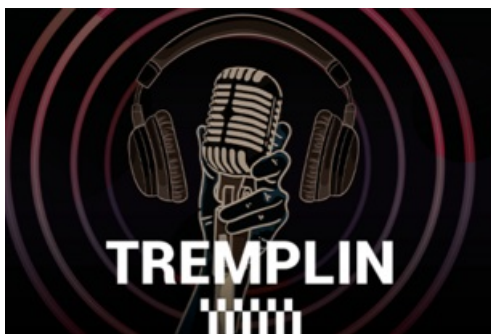
CP Tremplin Fête de la Musique 2024