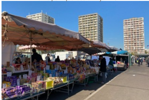
CP Affaire des marchés forains