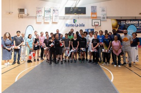
CP - Olympiades UNSS 78 - 31 mai 2023