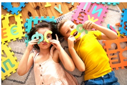
CP Ouverture de la Ludothèque Chopin aux 6-13 ans