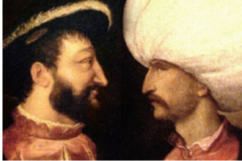
CP Exposition Les musulmans dans l'histoire de France