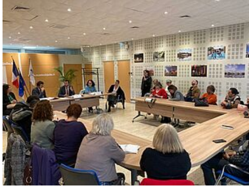
CP Projet territorial d'accueil et d'intégration