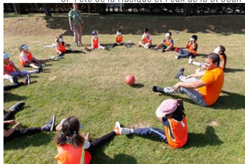
CP Journées Olympiques et Paralympiques