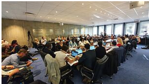
Dossier de presse du Conseil Municipal - 7 juin 2022