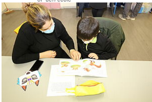
CP Hiver apprenant