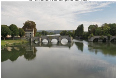
Dossier de presse exposition Terres de Seine 2022