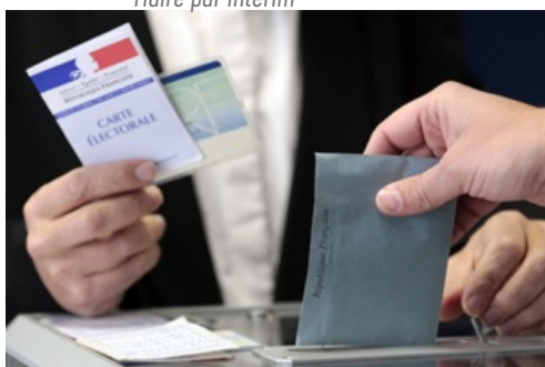
CP Élection Présidentielle 1er tour