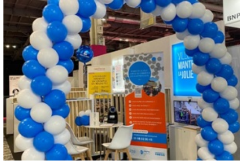
CP Salon Franchise Expo 2023