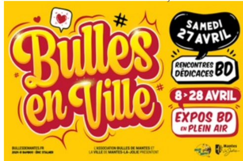
CP Bulles en Ville 2024