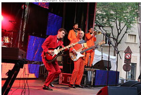
CP Annulations d'évènements