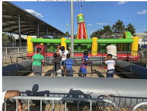
CP Un été de loisirs et d'éducation