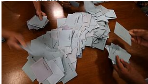
CP Election Municipale 1er tour