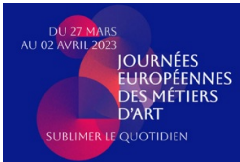
CP Journées Européennes des Métiers d'Art 2023