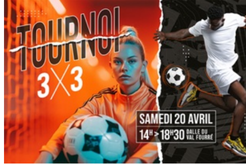
CP S3 Tournoi Foot Freestyle 2024