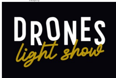
CP Drones Light Show