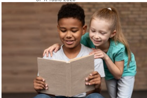
CP Il était une fois le CLAS