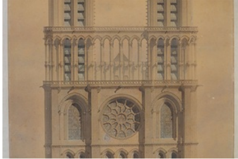
Dossier de presse exposition Alphonse Durand