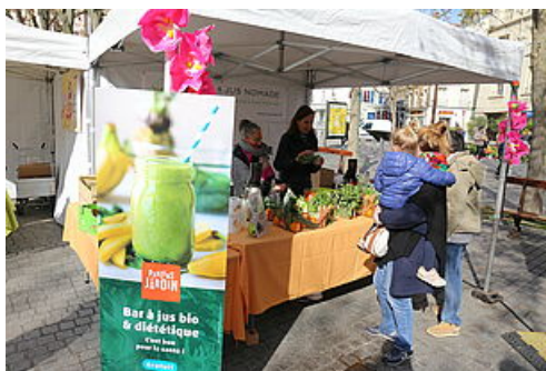
CP Parlons du Jardin