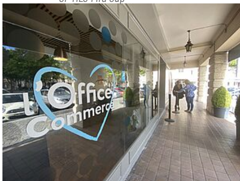
CP Office du commerce