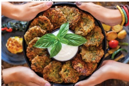
CP À Table 2023