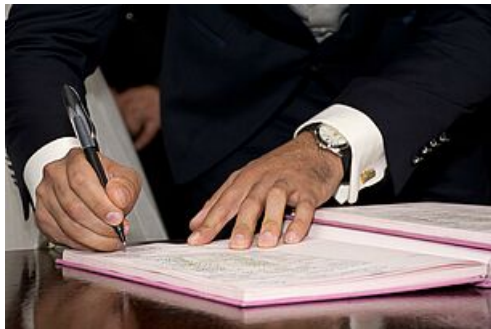
Charte de déontologie et d'éthique des élus du conseil municipal pour la moralisation de la vie politique locale - 7 juin 2022