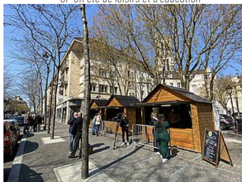
CP Village Restaurateurs