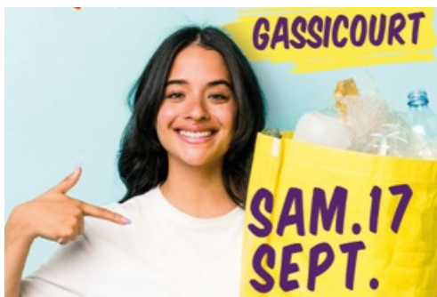
CP Opération "Coup de poing propreté" à Gassicourt