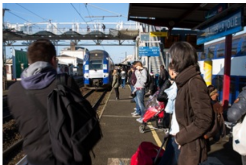
CP Suppression trains normands