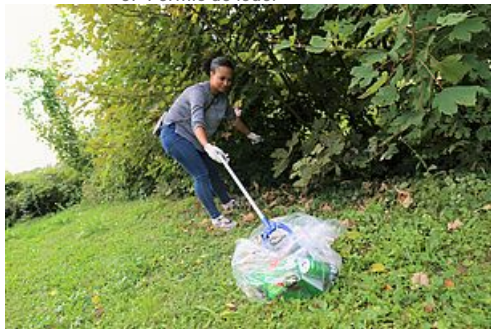
CP ramassage des dechets