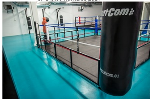
CP Inauguration Complexe sportif Haby Niaré