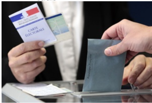
CP Election Présidentielle 2e tour