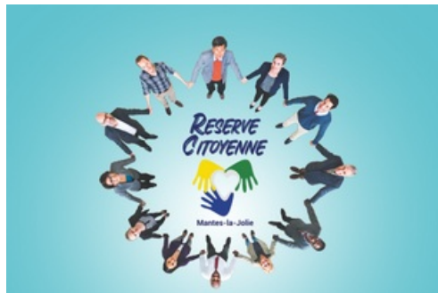
CP Réserve citoyenne