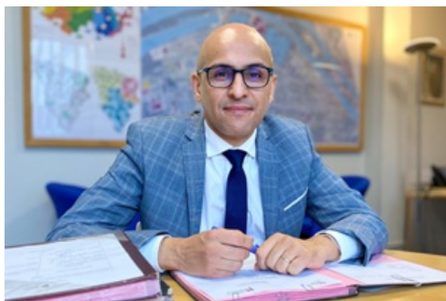
CP Election Présidentielle communiqué du Maire par intérim