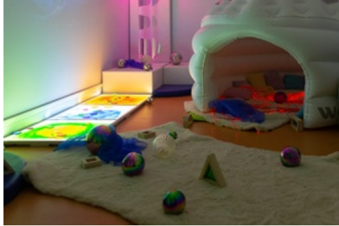
CP Inauguration - salle Snoezelen - Multi-accueil Pain d'Epices - 2023