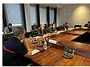
Photo de presse de l'école de voile, novembre 2020, pendant la prise en charge des SDF

Contrairement à ce qu'annonce un article mensonger, la distribution de repas aux SDF devant la Collégiale n'a pas été interdite par la Ville. A la demande de la Préfecture, pour des raisons sanitaires et juridiques, elle a en revanche été réorganisée. Elle a désormais lieu sur le parking de l'école de voile, distant de quelques centaines de mètres. Ce transfert a fait l'objet d'une étroite concertation avec les associations caritatives qui ont donné leur accord. Il permettra d'assurer la sécurité de la distribution des boissons et denrées alimentaires, dans un contexte d'évolution défavorable de l'épidémie de la Covid-19 et de respect exigé des précautions élémentaires liées aux gestes barrières.