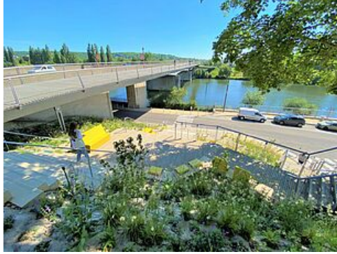
CP Belvédère fluvial