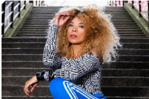
CP Concert de Flavia Coelho - Samedi 4 mai