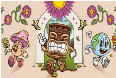
CP Festival 6ème Monde 2024