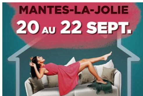
CP Salon Habitat 2024