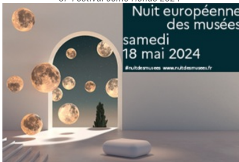
CP Nuit Européenne des Musées 2024