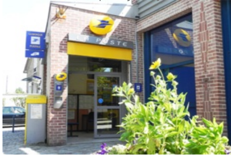
CP La Poste Quartier de Gassicourt