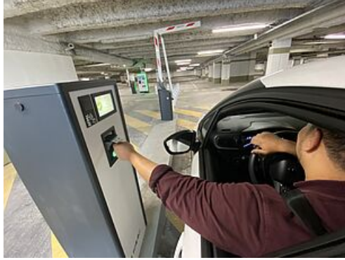
CP - Interparking - Indigo