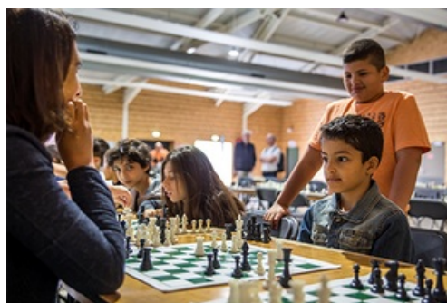
CP Tournoi d'Échecs