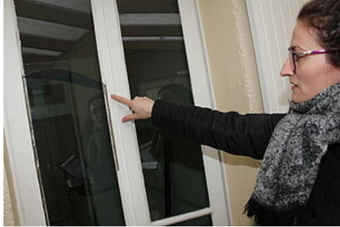
CP Permis de louer