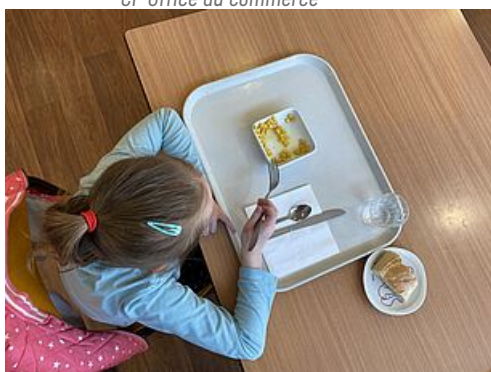
CP Organisation Restauration scolaire