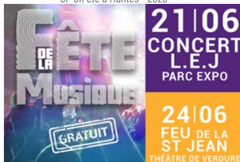
CP Fête de la Musique et Feux de la St Jean