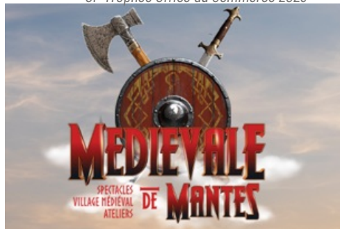
CP La Foire aux Dignons présente la Médiévale de Mantes 2023