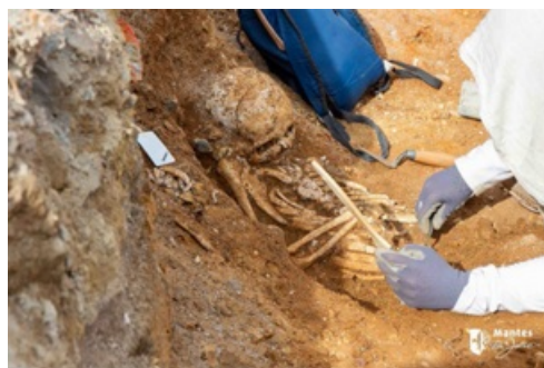
CP sur les fouilles archéologiques au centre-ville 2023