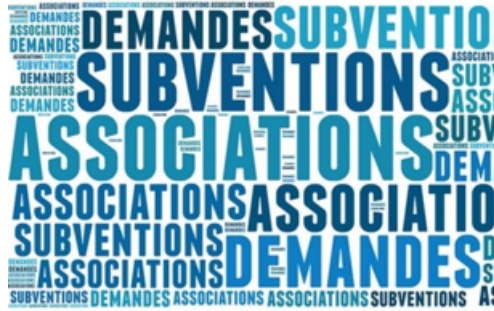
CP Subventions aux associations