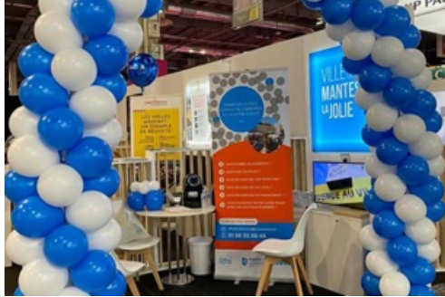
CP Mantes Franchise Expo