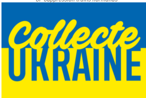
CP Dons Ukraine