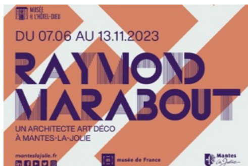
Dossier de Presse exposition Raymond Marabout