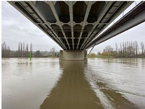
CP Crue de la Seine