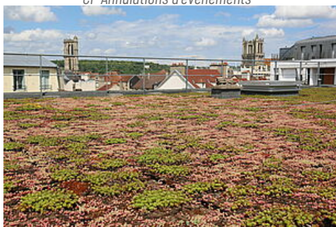
CP Assise de la transition écologique