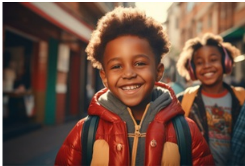
CP Tous en confiance avec le CLAS