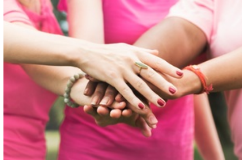
CP Octobre Rose 2023