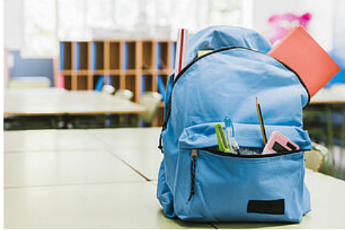
CP Rentrée 2022