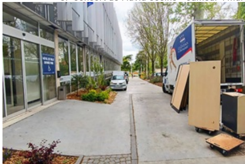
CP Travaux de modernisation pour l'Hôtel de Ville