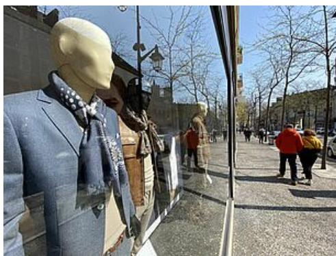
CP Action commerce