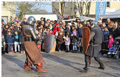
CP Foire aux Oignons 2021