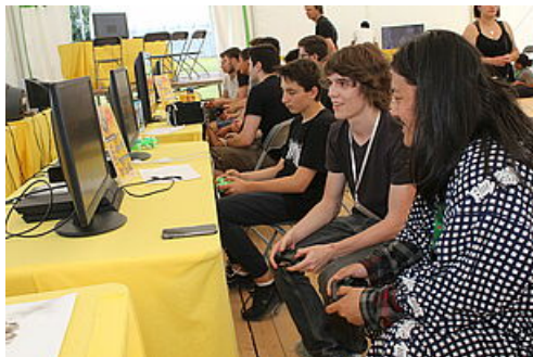
CP MLJ Fifa Cup