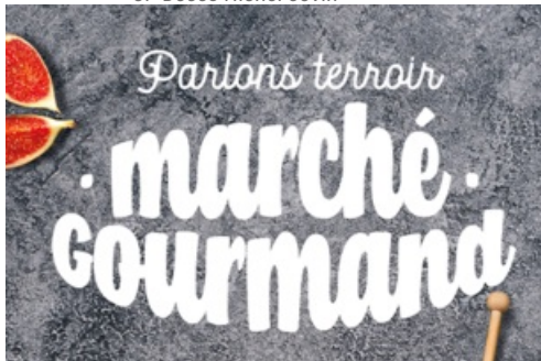
CP Parlons Terroir - Marché Gourmand - 2022