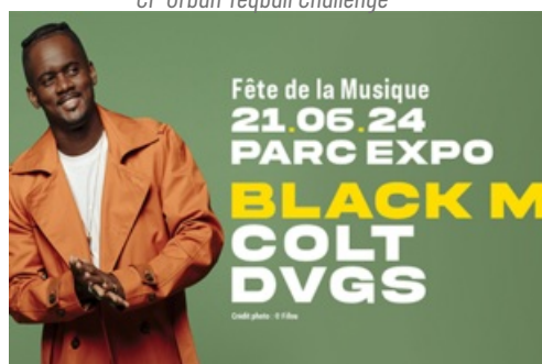
CP Fête de la Musique - Black M - 2024