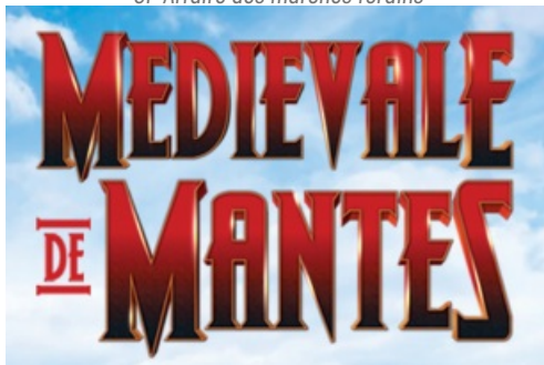
CP Foire aux Oignons - Médiévale de Mantes 2022