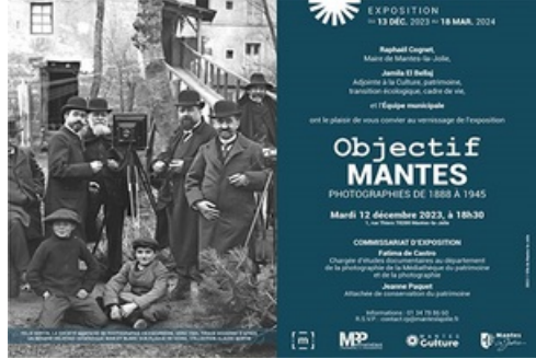
Dossier de presse exposition Objectif Mantes