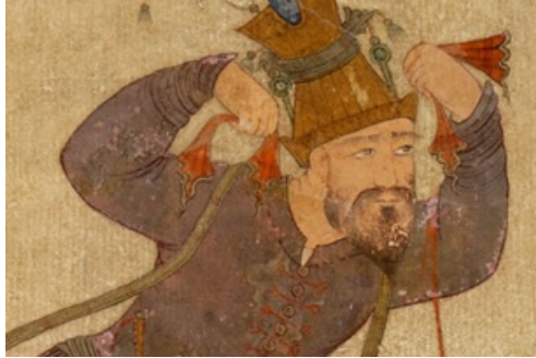
Dossier de presse Exposition Arts de l'Islam