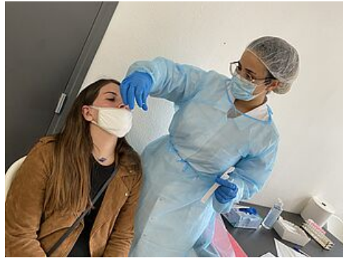
CP test antigénique