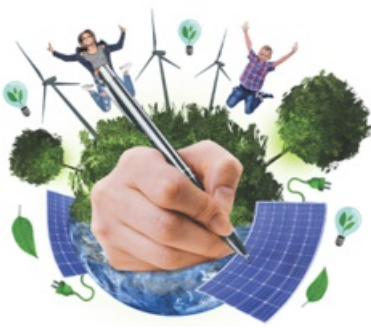
CP Dictée Mantaise