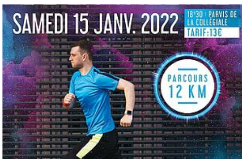
CP Trail de la Galette 2022