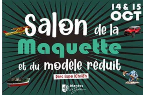
CP Salon de la maquette et du modèle réduit 2023