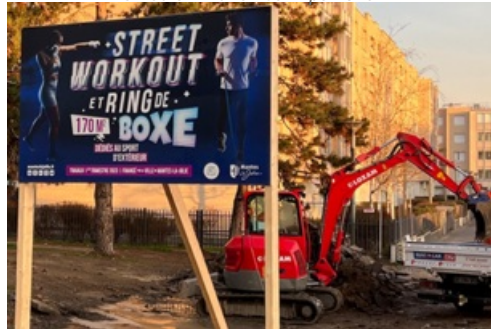
CP Nouveau Street Workout "Oumar N'Diaye"