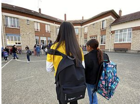
CP rentrée 2021