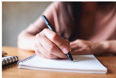
CP Dictée Mantaise 2024