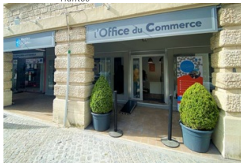
CP Trophée Office du Commerce 2023